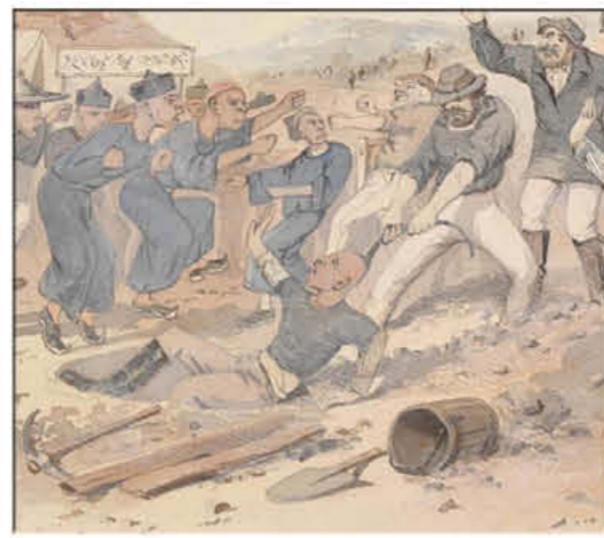
以上为：《力量与权利》——1861 年兰明低地 (The Lambing Flat) 暴乱；作者：S.T. Gill。此为临摹作品，选自 Doyle 博士的著作《素描本》，书号：PXA 1983，编号 114

Gill 用这幅画作表达了他的个人观点，即，正是这些不公正的事件最终导致了 1861 年兰明低地 (Lambing Flat) 暴乱的发生。Gill 不是同情华人矿工的唯一人士，即使在金矿场，许多人也支持“合平共处”。