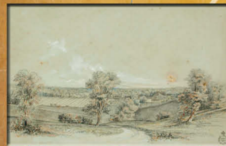
以上为：Demondrille；选自《Yass 及马兰巴拉 (Murrumburrah) 地区地图 185》，作者 J. Milbourne 夫人。此为铜版作品，由新南威尔士 (NSW) 州立图书馆 (Dixson 图书馆) 提供。尺寸：PX'D 331。数字编号：a6085003