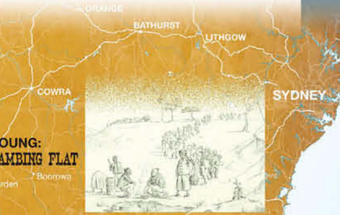
“华人矿工的采金之路”——Charles Lyall, 1854 此为临摹作品，由维多利亚州立博物馆提供，H87.63/2/4

许多华人从来就没有到过边界以南，因为他们发现新南威尔士州 (NSW) 的乡村很合他们的心意，并且只要他们出发，就总会有未采掘出的黄金资源丰富的新矿场等着他们。华人矿工从一开始就把赌注押在了兰明低地 (Lambing Flat)。