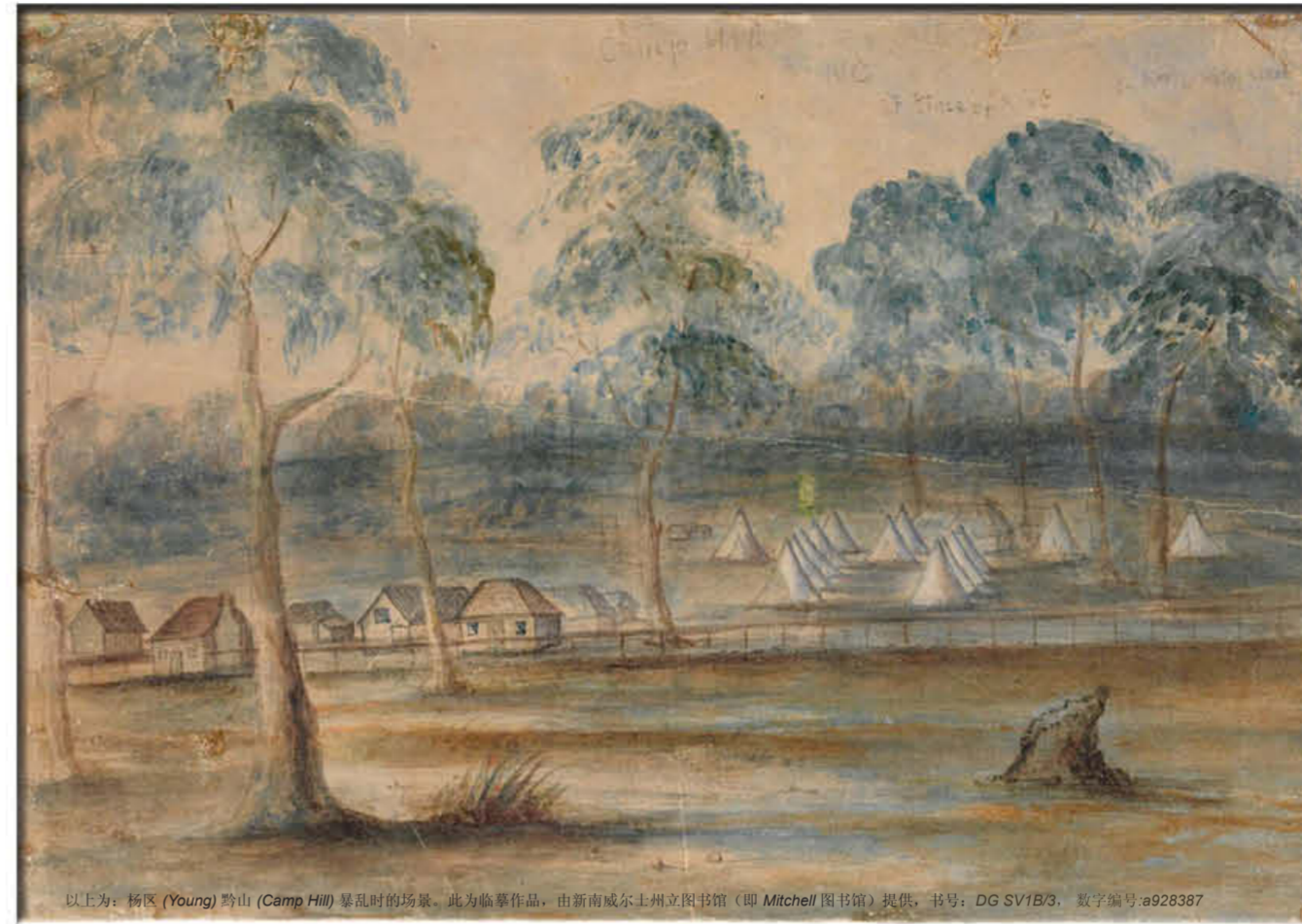
以上为：杨区 (Young) 的山 (Camp Hill) 暴乱时的场景。此为临摹作品，由新南威尔士州立图书馆（即 Mitchell 图书馆）提供，书号：DG SV1B/3，数字编号：a928387