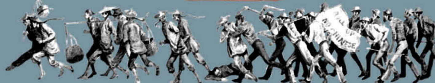
“1860 年兰明低地 (Lambing Flat) 的华人矿工罢工”的注释，由移民部门和多文化及本土事务局提供