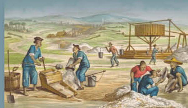
《洗砾尾矿》，由澳大利亚国家博物馆提供，nia.pic-an24794265

中国矿工在他国矿工认为无利可图的土地上以相互协调、组织有序的方式提取金矿，他们的成功在矿区引来了普遍怨恨。