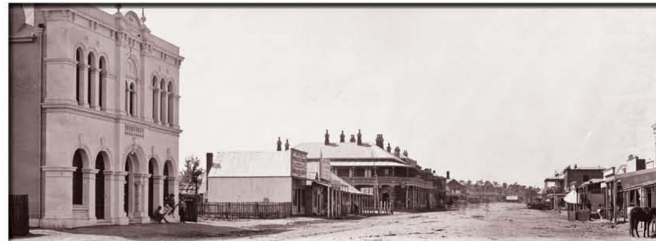
Burrows Street, 杨区 (以前的兰明低地, Lambing Flat)，此为临摹作品，由新南威尔士州立图书馆（即 Mitchell 图书馆）提供，书号：ON 4 Box 69 No 1034，数字编号：a2825287