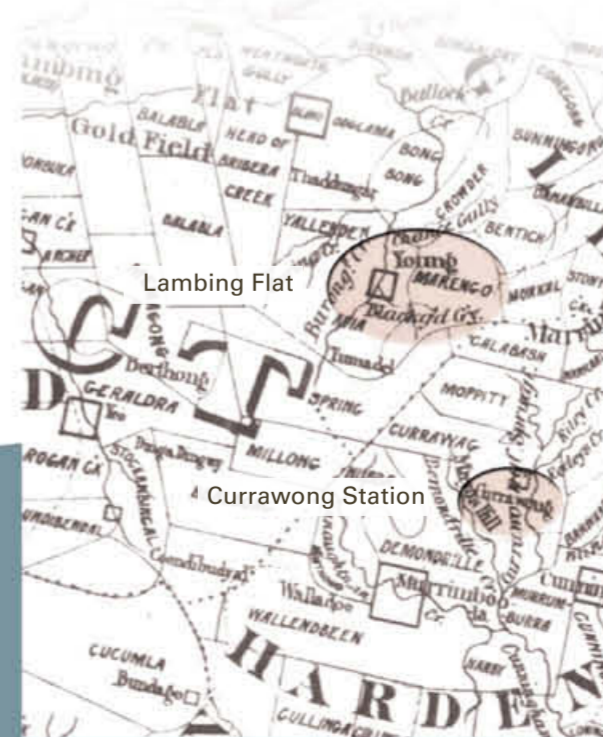
摘自 Reuss 及 Browne 的新南威尔士 (NSW) 州地图 1860-69。此为复制品，由澳大利亚国家图书馆提供，地图编号：NK 5928

增援部队随后到达。7 月 17 日，当局宣布执行戒严令，并从悉尼派来了增援分遣队。