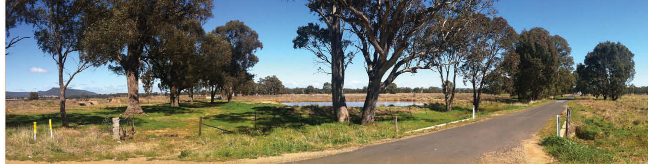
以上为：观赏宁静的乡间景观，它曾经是 Burrangong 金矿场，1500 名矿工曾集结于此将华人矿工驱离其金矿场。